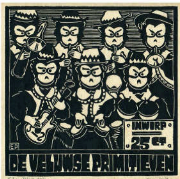
Bimbox / de Veluwe Primitieven (2014)