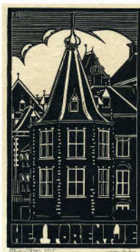
het Torentje (s Gravenhage / 2015)