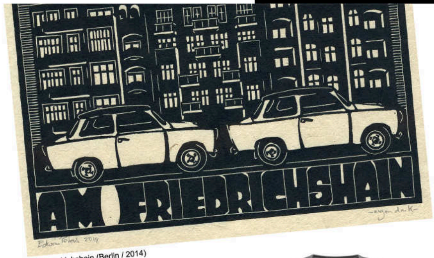
Am Friedrichshain (Berlin / 2014)

voltooide in 1989 de opleiding goud- en zilversmeden aan de Vakschool Schoonhoven. Na twee jaar HKArnhem (vrije kunst) volgde hij een theateropleiding en is sinds 1999 zelfstandig theatermaker. www.theaterterziele.nl