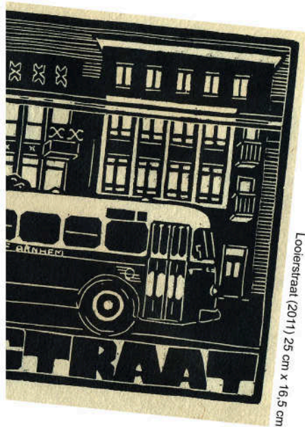
Looierstraat (2011) 25 cm x 16,5 cm