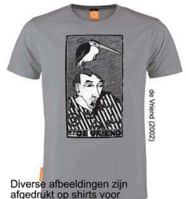
de Vriend (2002)

Diverse afbeeldingen zijn afgedrukt op shirts voor OKIMONO en verwerkt tot eco-vriendelijke Limited Editions. De OKIMONO Store is gevestigd in het Modekwartier in Arnhem. www.okimono.nl